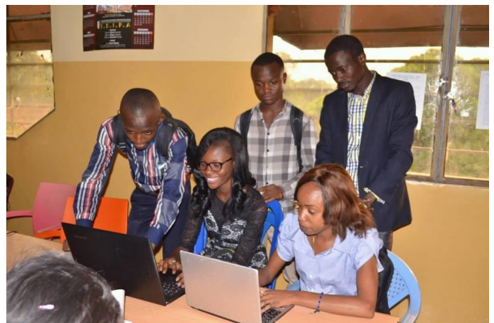
Figure 1 | Des jeunes étudiants de l'ISIPA en plein travail de groupe.

En effet, en deux ans, nous avons organisé une enquête au moyen de questionnaires papiers et d'interviews. En tout, nous dénombrons plus de trois milles répondants issus de quatre universités de Kinshasa et de Matadi. Rappelons en passant que, Kinshasa est la capitale de la République Démocratique du Congo (RDC), une ville sympathique qui vaut le détour ! Et, Matadi est la capitale de la province du Kongo Central, une ville très dynamique située à trois cent trente kilomètres de Kinshasa.