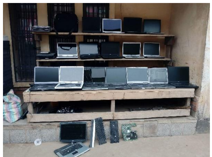
Figure 2 | Une boutique de laptops de seconde main, dite Bilokos en jargon congolais

Malheureusement, il nous faudrait insister sur le fait que la quasi-totalité de ces appareils (smartphones, agenda, laptops ou ordinateurs de bureau) sont de seconde main et présentent des caractéristiques peu enviables en termes de vitesse de processeur et/ou de capacité de stockage.